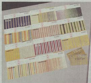
「小倉織」と「銀河鉄道999」をあしらった通帳とキャッシュカード

また、新銀行の開業に合わせて、JR小倉駅前の商業施設「2レトロ」2階に出張所「コレットプラス」を開業する。